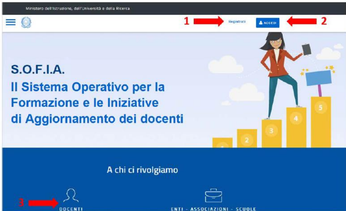
Figura 2- Home page della Piattaforma per la formazione dei Docenti

http://www.istruzione.it/pdgg/index.html